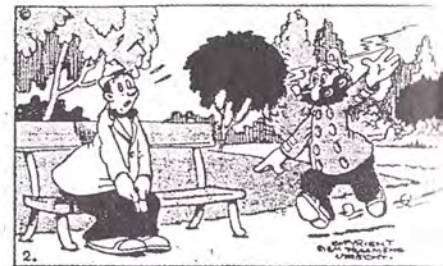
TEKST EN TEKENINGEN VAN SIEM PRAAMSMA