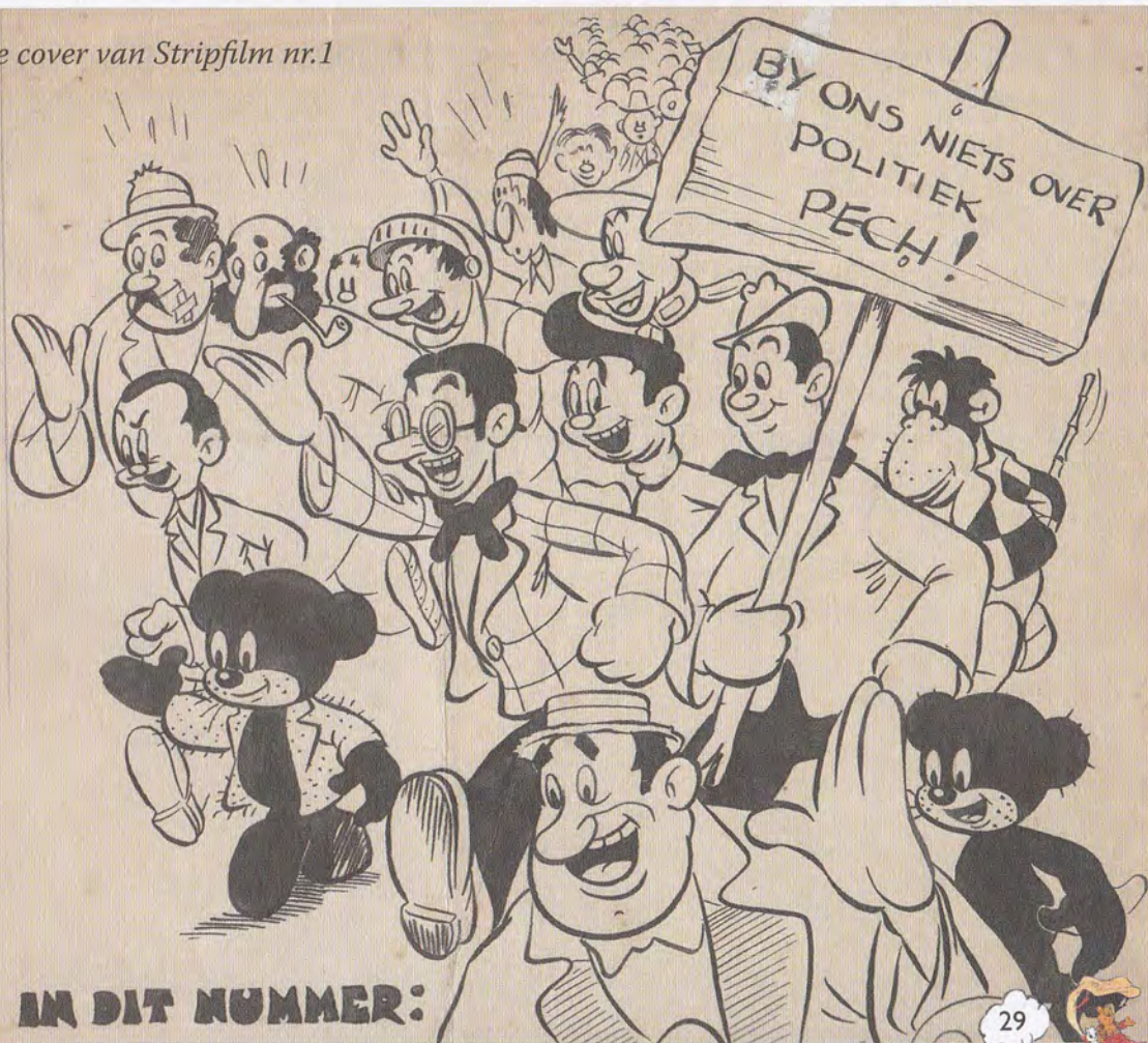
Orginele cover van Stripfilm nr.1

"Helaas is er nooit een foto gemaakt in de tijd dat ik daar werkte. Je moet begrijpen hoe een totaal andere tijd het was, in 1943-44. Ik denk dat je gearresteerd zou worden als je zonder vergunning met een camera rondliep. Niet alleen dat, maar als je zo'n apparaat bezat was het nog maar de vraag of je film op de kop kon tikken, want er was gebrek aan alles. Toen ik er begon was het duidelijk dat de onontbeerlijke cels mondjesmaat voorhanden waren en meerdere malen gebruikt werden door ze