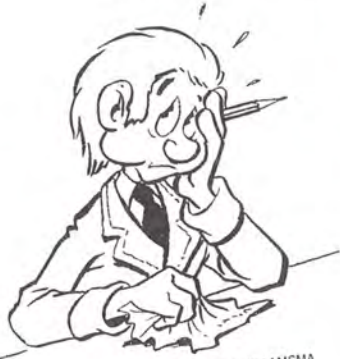
TEKST EN TEKENINGEN DOOR SIEM PRAAMSMA